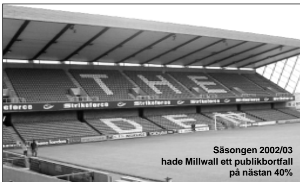
Säsongen 2002/03 hade Millwall ett publikbortfall på nästan 40%

Det troliga är väl att det beror på nästa generations sup-